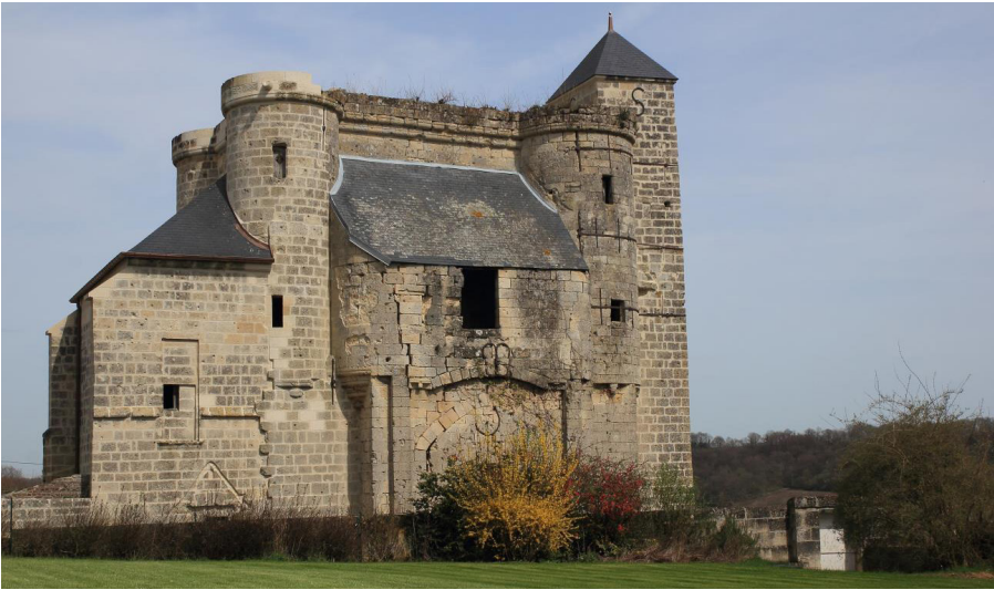
Le château de Pernant